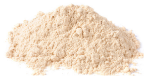
SOLUTEIN Soluble Protein Blend

AP 920 es una opción para uso en cerdos con estrés causado por úlceras y puede formularse en una dieta especial o usarse como cobertura (top-dress).