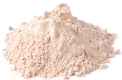
AP 920 | 820 Spray Dried Plasma Powder